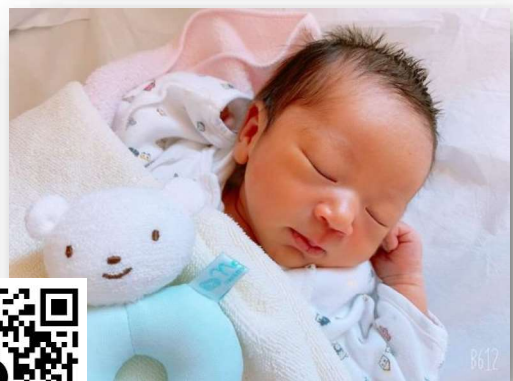
ゆい（熊本労災病院産婦人科通信）